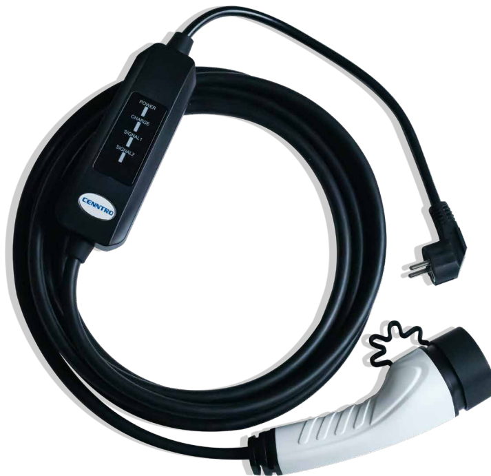
Nabíjací kábel Cenntro s konektorom Type2